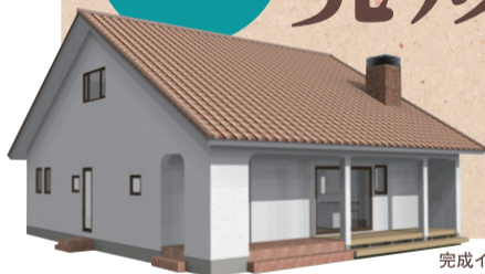
完成イメージパース